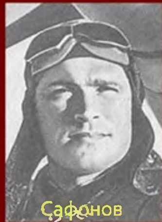
Сафонов Борис Феокистович