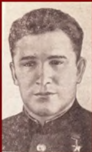
Борис Феоктистович Сафонов