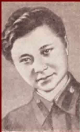
Ирина Фёдоровна Себрова